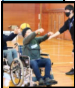
三条市地域おこし協力隊