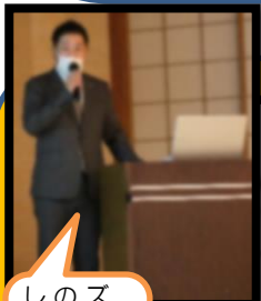
月岡温泉 ホテルひさご荘

新津本町活性化のため、空き店舗をリノベーションしたり地域の特色を発信したりしながら、次世代につながる街づくりに取り組んでいます。