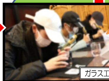
ガラス工房 びいどろ