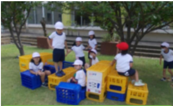
みんなと協力して、ひかりランドを作ったよ