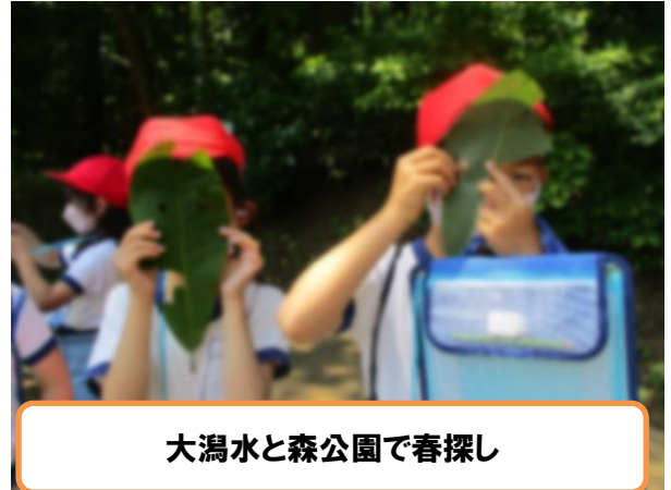
大瀧水と森公園で春探し

1年生の学年目標は、「なかよく げんき かしこいなかま」です。1年生にとっては初めての小学校生活や学習に、戸惑うことが多くあると思います。そんな中でも、「みんなと仲良く、いろいろなことにチャレンジし、友達や動物、これから出会うたくさんの人たちと絆を深めたい」と設定しました。入学してからどんなことにチャレンジしたか紹介します。