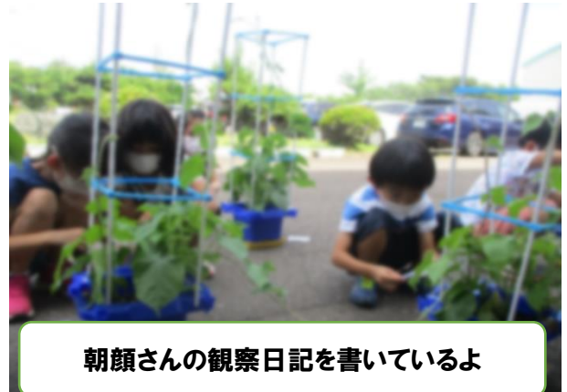
朝顔さんの観察日記を書いているよ